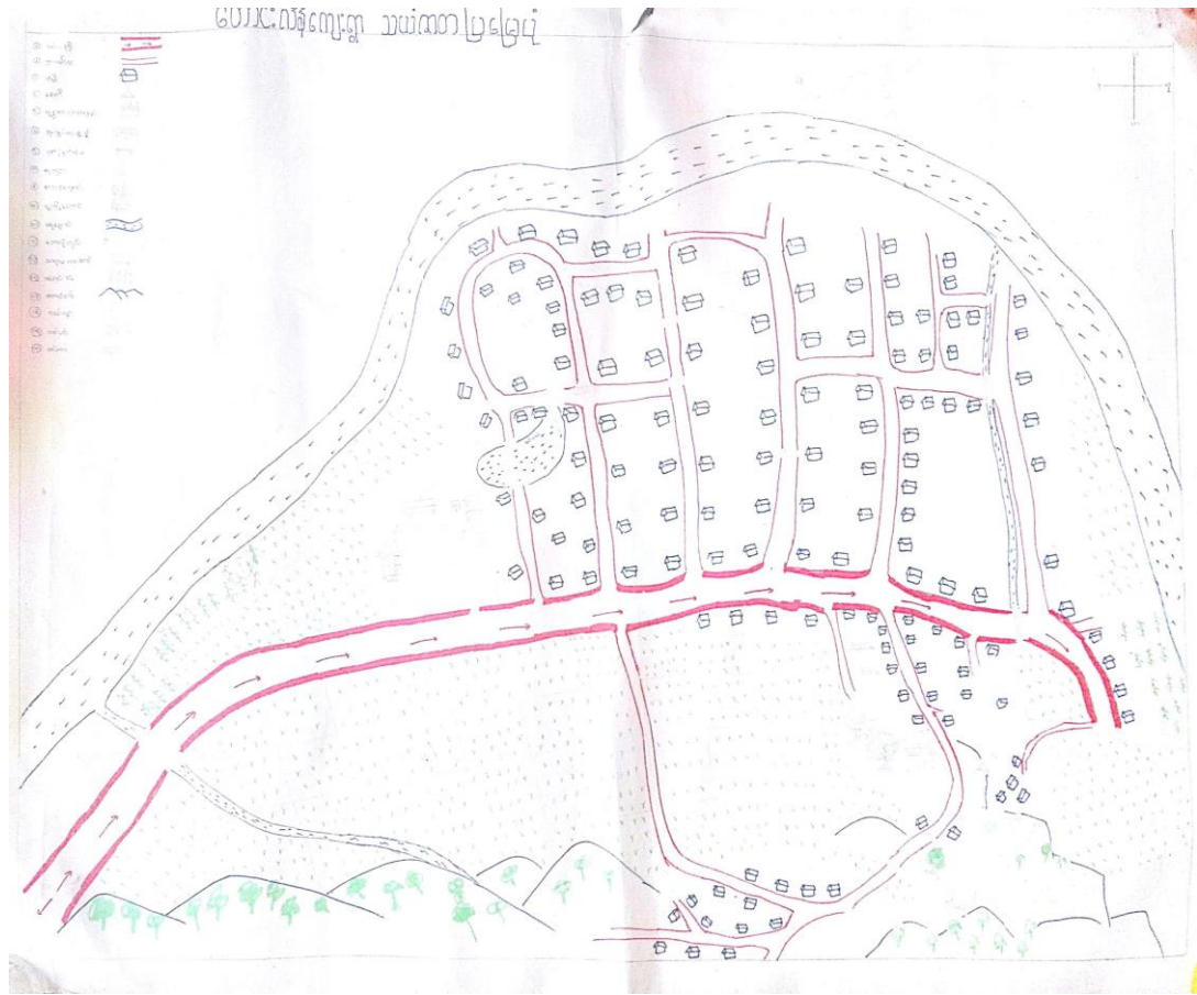
ဟောင်းလိန်ကျေးရွာဇာတပြမြေပုံ